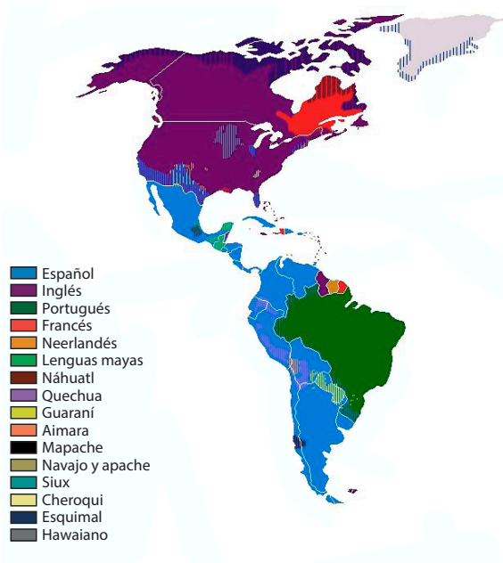
Mapa 1. Idiomas en América

En el siguiente mapa se presentan las lenguas que existen en América, para ilustrar el reto que tienen las organizaciones sindicales ante el tránsito a la transnacionalidad .