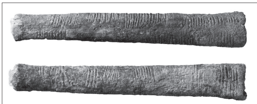
Figura 2. Hueso de Ishango