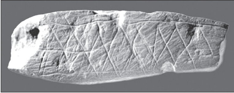
Figura 1. Ocre de Blombos - Sudáfrica