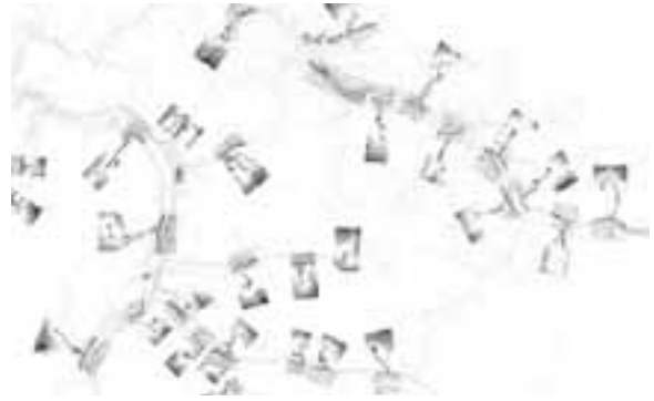
Figura 1: Espacialización de la ocupación funcional.

Una forma de realizar el abordaje de las territorialidades a través de la metodología de territorio aplicada en Barcelona 2 aquí se presentan las Territorialidades, ellos partieron de la pregunta ¿EXISTEN LÓGICAS QUE DETERMINEN LA DIFERENTE FORMA DE DISPONERSE EN EL TERRITORIO? y luego de analizar el territorio encontraron que existen dos disposiciones de ocupación, una funcional por la industria y otra por las actividades complementarias a ese oficio, (Véase Figura 1).