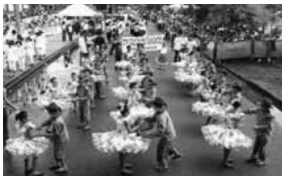
Figura 5: Joropodromo.

Por otra parte, la tradición dicta, en una reunión o encuentro con animo de intercambiar alegrías y diversión, en su momento fue el “Baile típico llanero”, la mutación modifico la forma de manifestación, hoy se presenta en el Joropodromo, el baile llanero por excelencia, (Véase Figura 5), Mencionan los conocedores del joropo “Del baile del joropo campesino al joropo urbano 13 .”