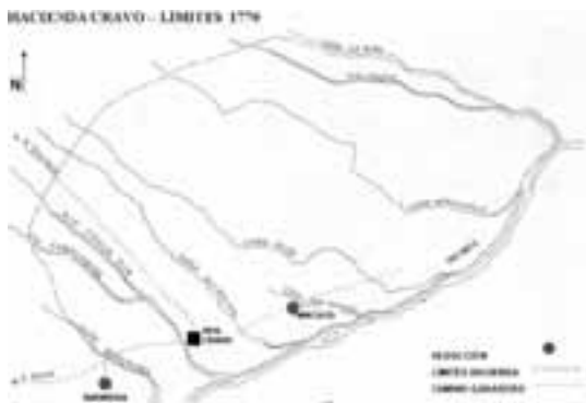
Figura 2: Tránsitos sobre el río Meta. Tomado de Felipe González, reducciones y haciendas Jesuíticas en el Casanare, Meta y Orinoco. Doctrinas Jesuíticas; 2005.

La Compañía de Jesús, se estableció en territorio colombiano en 1604, aclarando que llegaron al territorio de estudio en 1740; y fueron expulsados de los dominios españoles en 1767. La comunidad fue restituida en 1814 y volvió al país en 1844. La misión de la compañía es el servicio de la fe y promoción de la justicia este comprende varios campos y dimensiones: Apostolado parroquial, de trabajo pastoral y en tierras de misión.