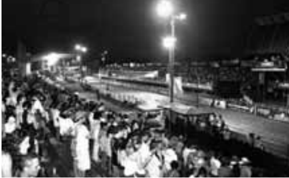
Figura 6: Manga de coleo.

mismo, tumbar la res, además, asistieron otras delegaciones de: Argentina, Mejico, Uruguay, estados unidos, entre otros.