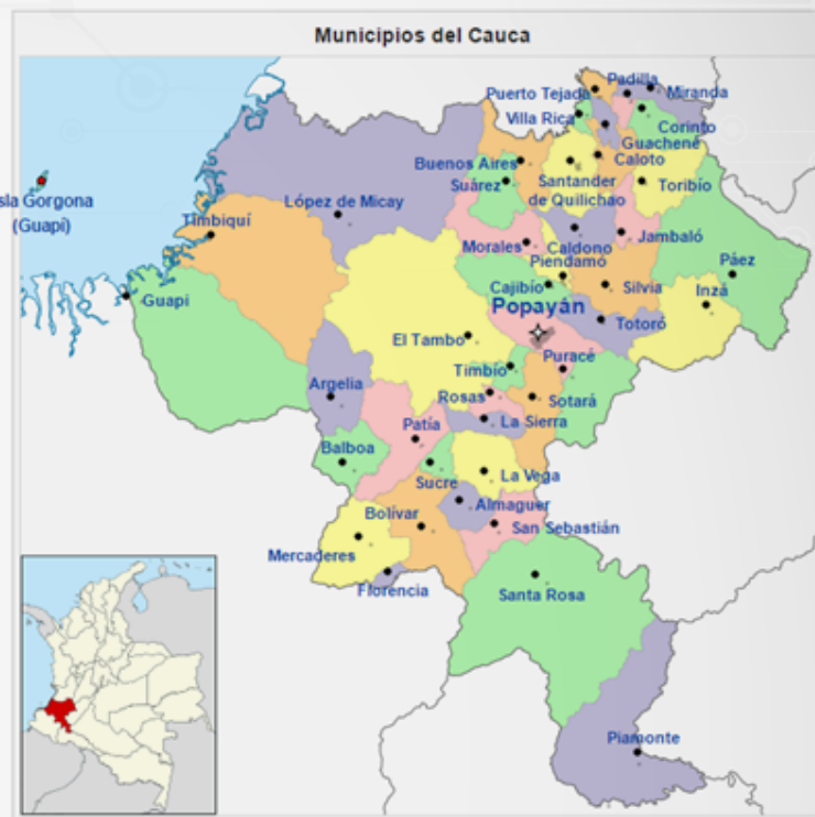
Ubicación del departamento del Cauca en territorio Colombiano

Indígena del Cauca, CRIC, que representa a 84 resguardos y 115 Cabildos. Entre los indígenas que han habitado esta región están los Paeces, Guambianos, Aviramas, Totoroes, Polindaras, Paniquitaes, Coconucos, Patías, Bojoles, Chapanchicas, Sindaguas, Tambas, Jamundíes y Cholos.