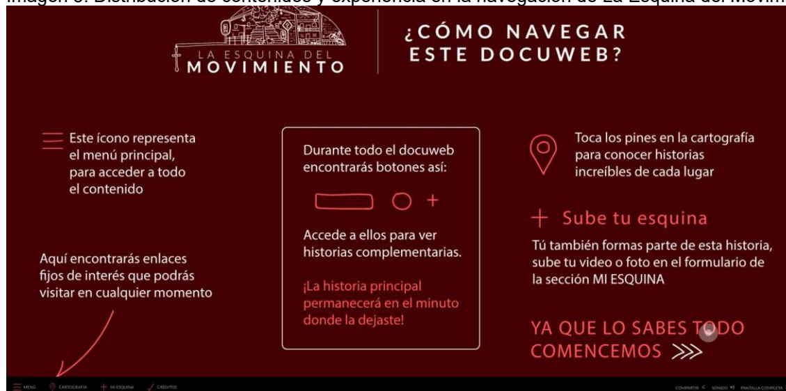
Imagen 5. Distribución de contenidos y experiencia en la navegación de La Esquina del Movimiento.