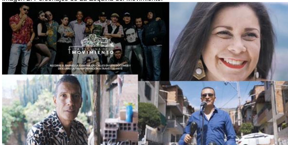
Imagen 2. Personajes de La Esquina del Movimiento.

primeras personas, por los sujetos que hacen parte de la Esquina, montaje escénico que cuenta las vivencias humanas, sociales y circunstanciales de jóvenes y adultos permeados por el conflicto armado en sus barrios a partir de la década de los noventas. La producción para la web está contada en el orden de los personajes que dan testimonio de sus hechos y acciones en los lugares donde habitan. Cada personaje genera su micro mundo narrativo de experiencias y alusiones urbanas; que al final, se ven conectadas bajo el ambiente escénico que La Esquina del Movimiento quiere expresar: la música, el arte y el teatro como mecanismos de empoderamiento y resistencia social.