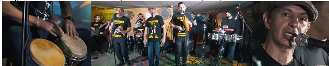
Imagen 4. La música como ejercicio de inclusión y expresión de la realidad de los barrios.