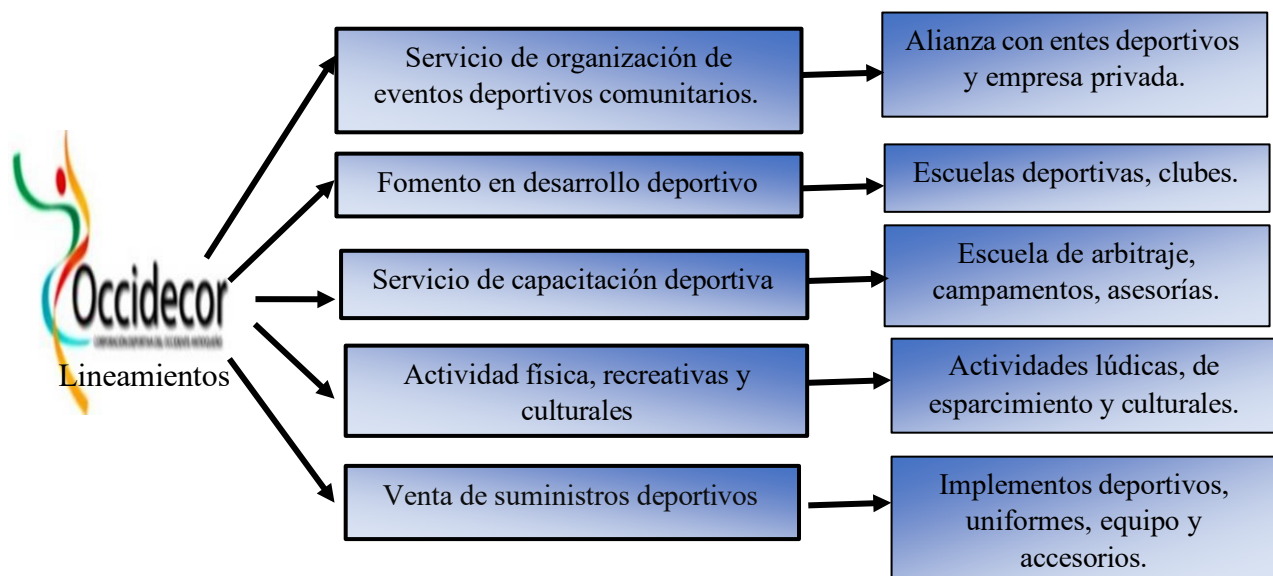
Figura 3 Lineamientos Occidecor

Nota 3: representación gráfica de la propuesta de lineamientos y la aplicación en la corporación Occidecor